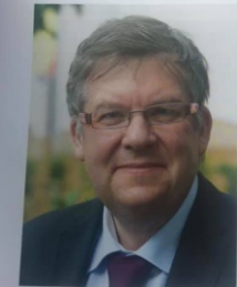
mit dem SPD-Landtagsabgeordneten aus Ochsenfurt in Unterfranken, Volkmar Halbleib. Der Haushalts- und Finanzexperte ist seit 2008 im Bayerischen Landtag und seit 2013 parlamentarischer Geschäftsführer der SPD-Fraktion.